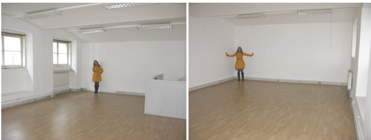
Abb. oben: Rundblick in Raum 2 (im 1. Stock) vor der Renovierung im Mai 2009

Raum 2 - Seminarraum im OG: 50 m 2 Nutzfl. (ohne Stiegen gerechnet), heller, ruhiger Raum mit hohen Fensterbänken. Flipchart / Beamer auf Wunsch. Stereo-Analge vorhanden.