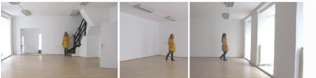
Abb. oben: Rundblick in Raum 1 (im Erdgeschoss) vor der Renovierung im Mai 2009

Raum 1 - Seminarraum im EG: 54 m 2 Nutzfläche (ohne Stiegenaufgang gerechnet), hell und mit Sichtbeziehung zur Liechtensteinstraße (gute Wahrnehmung durch die PassantInnen), Seminarbestuhlung, Flipchart und Beamer auf Wunsch. Stereo-Analge vorhanden.